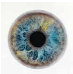
Marc Quinn: IRIS (We Share Our Chemistry with the Stars), 2010

Årets utstilling i kunsthallen bar tittelen All of Nature Flows Through Us, en separatutstilling med den britiske kunstneren Marc Quinn. Her ble noen av de aller nyeste arbeidene til Quinn presentert. Utstillingen var et samarbeid mellom Kistefos-Museet, Galleri Brandstrup og White Cube. Det var første gang noensinne at Quinn, en av Englands mest internasjonalt anerkjente kunstnere, holdt separatutstilling i Skandinavia.