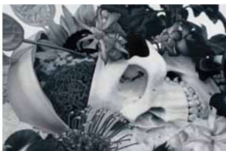
On the Separation of Body and Soul (Skeleton Coast Namibia), 2010