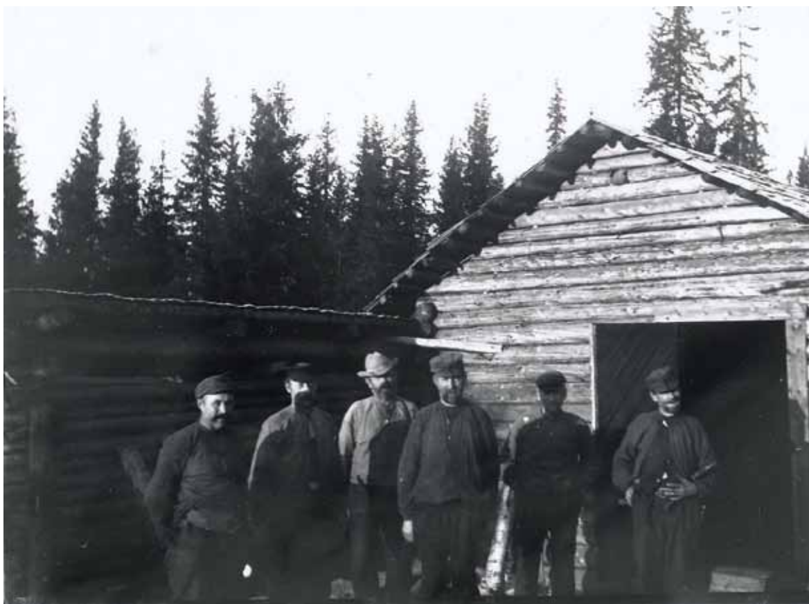
Skogsarbeidere i A/S Kistefos Træsliberis skoger

Formannsboligen: I sesongen 2011 sto Kistefos-Museet for en egenprodusert historisk utstilling i formannsboligen. Utstillingen hadde tittelen "Sympatistreik og Rettergang: A/S Kistefos Træsliberis rolle i Randsfjordkonflikten", og utstillingen, som tittelen indikerer, presenterte historien om den arbeiderkonflikten som pågikk i Randsfjorddistriktet mellom 1930 og 1936. Konflikten dreide seg om skogsarbeidernes harde kamp for retten til å organisere seg i egne fagforeninger. Skogeiernes motstand til slik fagorganisering var stor, og i tider med arbeidsledighet var det ikke vanskelig å finne streikebrytere som ville jobbe. Dette førte til dramatiske konflikter mellom skogeiere og streikebrytere på en side og skogsarbeiderne med deres sympatisører på den andre.