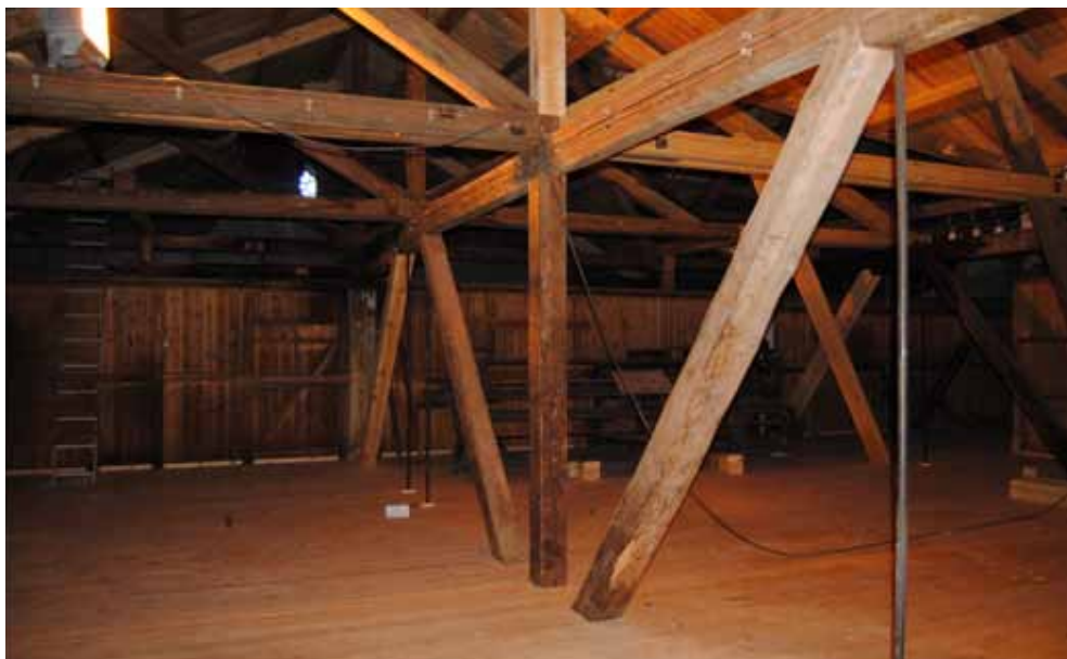
Loftet i tresliperiet etter restaurering

I 2011 ble imidlertid Fyrhuset og Renseriet tilknyttet industrimuseet åpnet for publikum igjen etter at rehabiliteringsarbeidet på disse ble ferdigstilt i 2010.