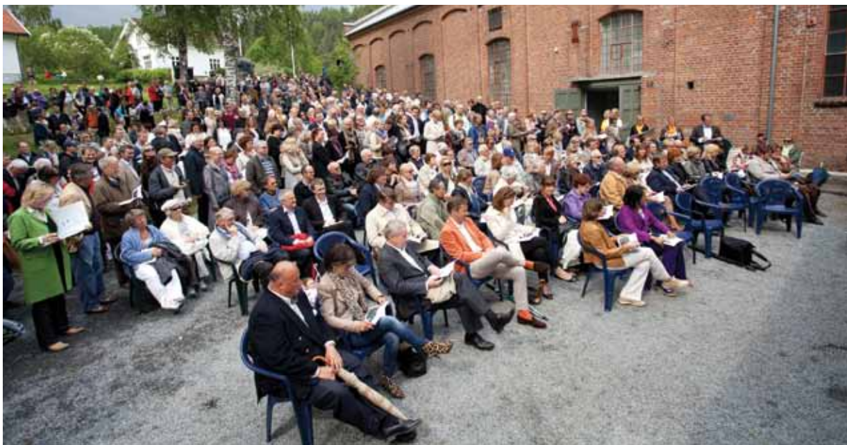
Publikum foran hovedscenen i forbindelse med kunstauksjonen Just Around the Corner på åpningsdagen 22. mai 2011

Sesongen 2011 ble avsluttet søndag 9. oktober.