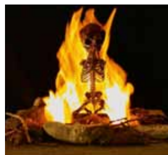
Matter into light: Every Atom in us is as old as the Universe, 2011

Utstillingen i kunsthallen omhandlet evig aktuelle tema som vår eksistens i et større perspektiv og menneskenes dødelighet. Identitet var også et viktig stikkord for denne utstillingen, hvor både nye skulpturer og malerier ble utstilt. Quinn sto også bak 2011-sesongens nye skulptur på Kistefos-Museet. Tittelen på verket er, som utstillingen, All of Nature Flows Through Us (2011), og den ble plassert i elva utenfor kunsthallen. Skulpturen er laget i bronse og er ca. 10 meter i diameter.