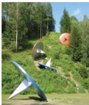
Tumbling Tacks, 2009