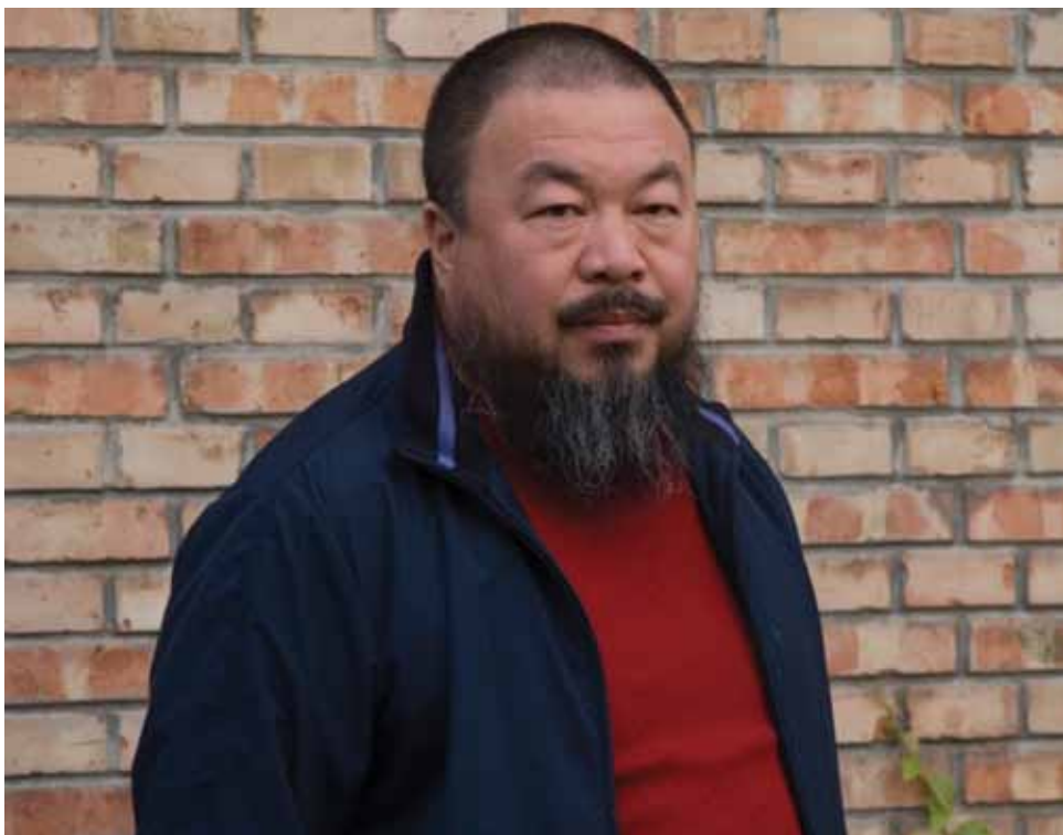
Ai Weiwei

Ai Weiwei veksler mellom rollene som konseptkunstner, arkitekt, kurator, designer, filmkunstner og samfunnsaktivist og viser med dette hvordan samfunn og kunstproduksjon henger sammen. I 2011 ble Weiwei nominert som en av verdens viktigste personer av Time Magazine, og ble kåret som verdens mektigste kunstner av ArtReview samme år. Med årets utstilling på Kistefos-Museet blir det første gang Ai Weiwei viser arbeider i Norge.